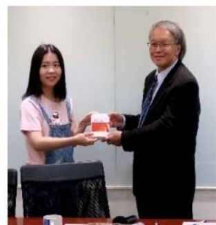
鄺院長致贈基本小六法書